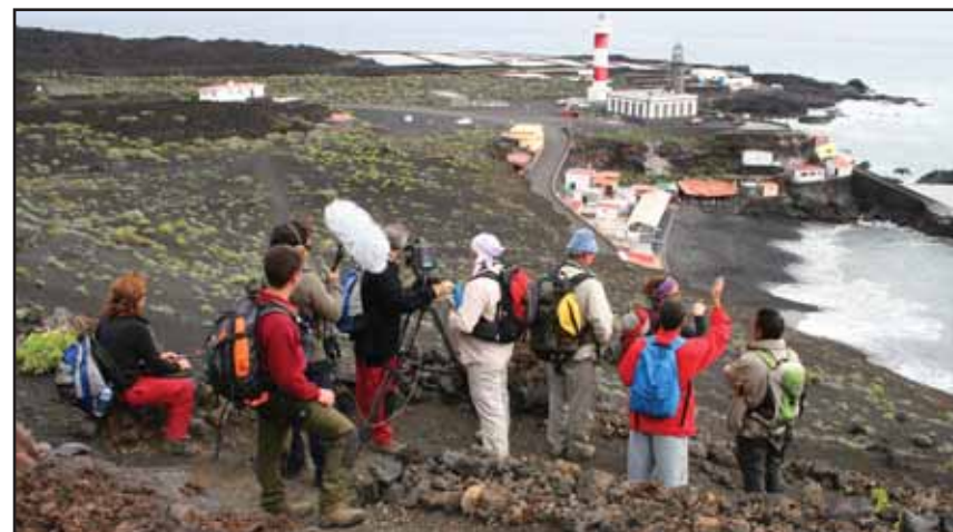
Un equipo televisivo de filmación en el Faro de Fuencaliente. Las salinas están en segundo plano

Más sobre el Faro de Fuencaliente en la página 155